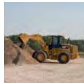
MATÉRIEL CATERPILLAR : 938H

Proposer une gamme de prestations et de services aux meilleurs standards des constructeurs, c'est l'objectif fixé par toutes les Représentations Africaines du réseau JA Delmas Export, concessionnaire Caterpillar pour l'Afrique de l'Ouest. ■