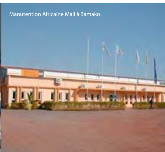
Manutention Africaine Mali à Bamako