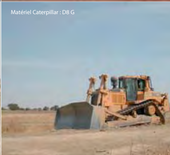
Matériel Caterpillar : D8 G