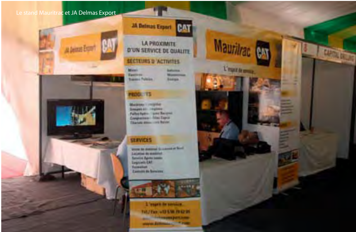
Le stand Mauritrac et JA Delmas Export

La première Conférence et Exposition sur les Mines de Mauritanie s'est tenue à Nouakchott en Mauritanie du 9 au 11 Novembre 2010 en l'honneur du 50ème Anniversaire de L'Indépendance de la Mauritanie.