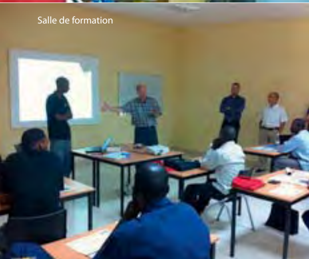
Salle de formation