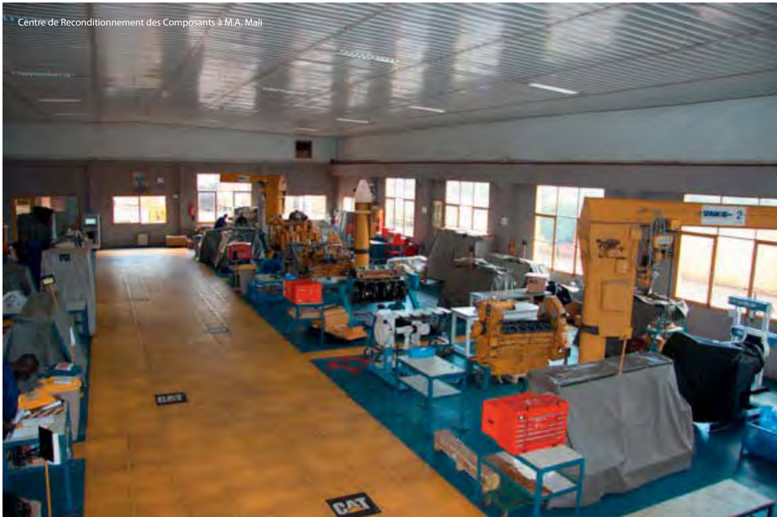
Centre de Reconditionnement des Composants à M.A. Mali

Le C.R.C. remet en état les composants (moteur, transmissions, chaînes cinématiques, etc.) selon des méthodes rigoureuses préconisées, contrôlées et labellisées par Caterpillar. Certains engins (les tombereaux miniers, les génératrices électriques de grande puissance) peuvent atteindre des valeurs de plusieurs millions de dollars, et être mis en opération 24 heures sur 24. L'objectif des utilisateurs est donc de maximiser la durée de vie de ces équipements. Dès lors, les matériels les plus coûteux et les plus utilisés ont « plusieurs vies » : ils font l'objet de plusieurs reconstructions complètes.