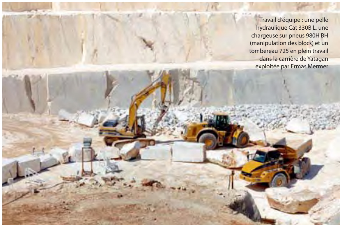
Travail d'équipe : une pelle hydraulique Cat 330B L, une chargeuse sur pneus 980H BH (manipulation des blocs) et un tombereau 725 en plein travail dans la carrière de Yatagan exploitée par Ermas Mermer