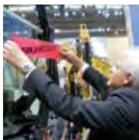
La pelle sur pneus Cat M318C exposée sur le stand de Caterpillar au salon Bauma, avec sa pancarte 'Vendue à Penzenstadler GmbH'.