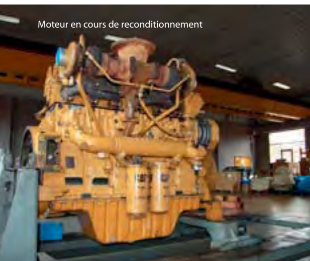
Moteur en cours de reconditionnement