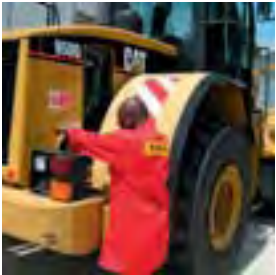
Pratique sur machines

La durée est de 13 semaines continues et comporte 2/3 de pratique encadrée et 1/3 de théorie. 90 stagiaires sont ainsi formés chaque année.