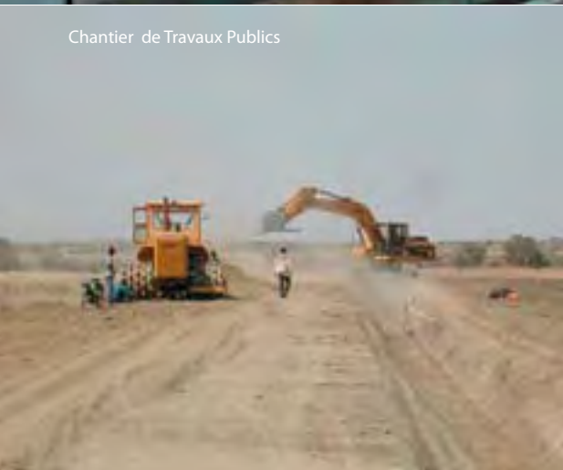
Chantier de Travaux Publics