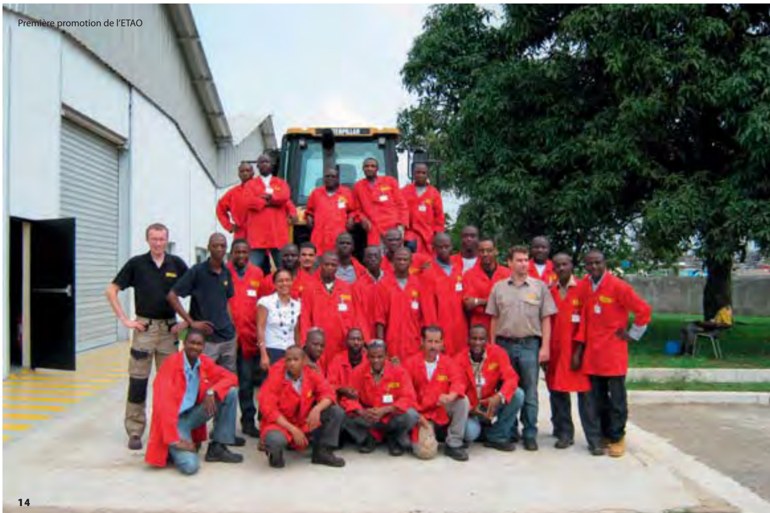
Première promotion de l'ETAO