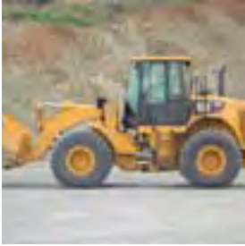
MATÉRIEL CATERPILLAR : 950H

UN CENTRE DE RECONDITIONNEMENT DES COMPOSANTS (C.R.C.), À BAMAKO, AU SERVICE DES SECTEURS DU BTP, DE L'ÉNERGIE ET DES MINES.